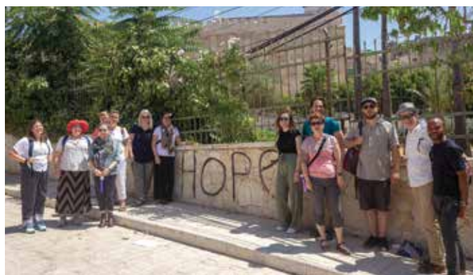
Photo : Des jeunes pour la paix en Palestine.

Venant de diverses situations et de divers contextes au Canada, les membres du groupe ont rencontré surtout des enfants, des jeunes et de jeunes adultes palestiniens et israéliens. Ils ont écouté leurs témoignages et ont pris connaissance de leurs réalités, de leurs espoirs et de leurs aspirations. Par la voie de la campagne No Way to Treat a Child [Ce n'est pas ainsi qu'on traite des enfants], menée par Défense des enfants international–Palestine, un partenaire de Mission & Service, l'Église Unie et d'autres organismes de la société civile canadiens travaillent à sensibiliser le public sur les nombreuses violations de droits que