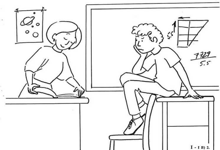
2. Lorraine, l'enseignante, l'emmène dans la classe et lui propose de dessiner pour le projet de recherche.