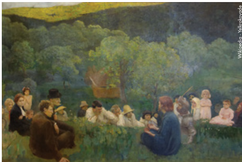
■ Károly Ferenczy, Le Sermon sur la montagne

Qu'est-ce qui se cache derrière ce mot « heureux » ? Jésus ne parlait pas grec, mais araméen, et pour ce qui est de la religion, toutes ses références étaient en hébreu. André Chouraqui, fin connaisseur de ces trois langues, a cherché là la clé de l'énigme. Sous le mot grec makarioi , qu'on traduit par « heureux », il trouve le mot hébreu ashrei qui signifie « en marche », qui « évoque la rectitude de l'homme en marche sur une route qui va droit vers IHVH... » 1 .